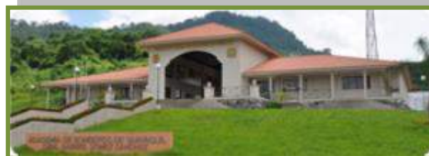
Academia de Bomberos