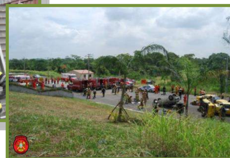
Curso SAR España