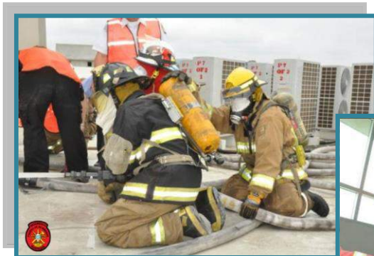
Práctica en Edificio