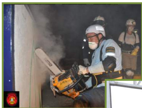
Curso BREC Internacional