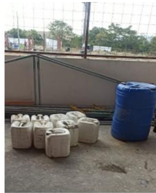
4. CANECAS Y TANQUE DE ESPUMA