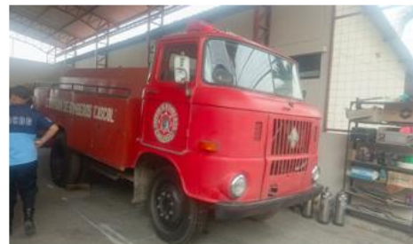
6. VEHÍCULO AUTOTANQUE PARA MUSEO