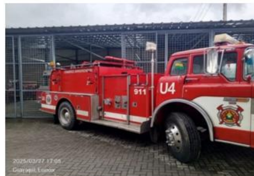
2. TRES VEHÍCULOS TERRESTRES MARCA FORD