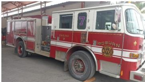
5. VEHÍCULO MOTOBOMBA CON EQUIPAMIENTO