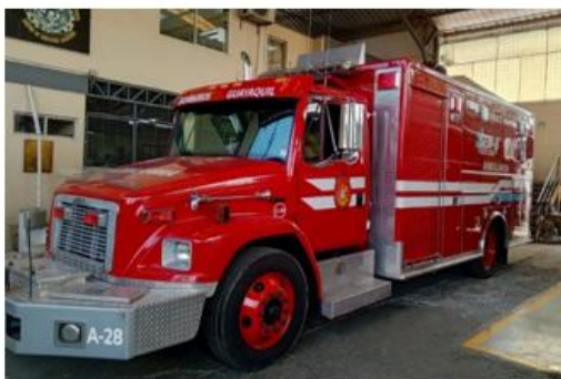
1. AMBULANCIA A DIESEL MARCA FREIGHTLINER