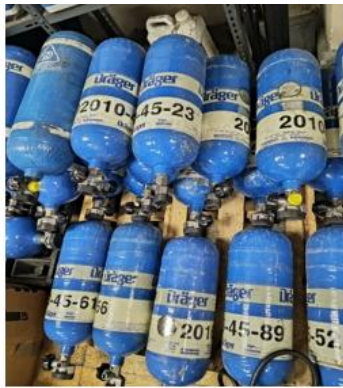
3. EQUIPOS DE RESPIRACIÓN AUTÓNOMA