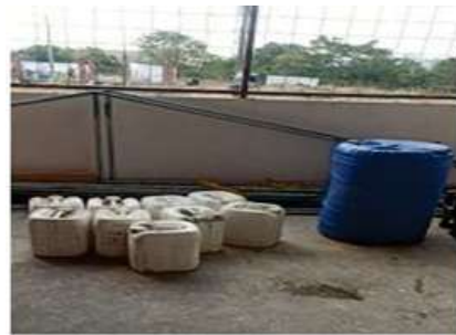
CANECAS Y TANQUES DE ESPUMA