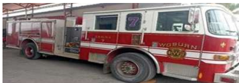
VEHÍCULO MOTOBOMBA DE EQUIPAMIENTO