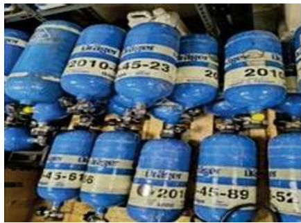
EQUIPO DE RESPIRACIÓN AUTOMÁTICA