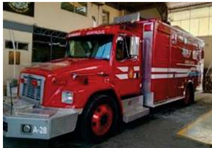
AMBULANCIA A DIESEL MARCA FREIGHTLINER