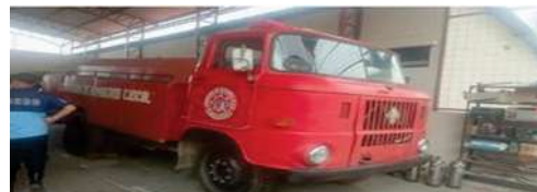
VEHÍCULO AUTOTANQUE PARA MUSEO